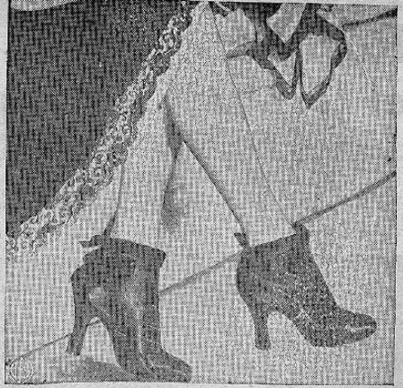
FLIESE EN LAS BOTAS — Se predice que para el otoño estarán muy de moda las botas que aparecen en esta foto. Este par son de satin negro. Llevan una cinta en la parte superior.

maciones, que ponen muy en alto el progreso alcanzado en los órdenes científico y artístico por la Confederación.